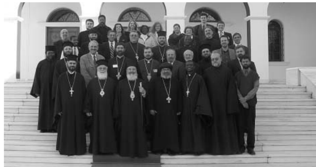
Στιγμιότυπο ἀπό τήν προπαρασκευαστική Διορθόδοξη Συνάντηση στήν Πεντέλη.

Στό Συνέδριο, τό 13ο τοῦ εἴδους, ἀναμένεται νά λάβουν μέρος περίπου 500 ἐκπρόσωποι Χριστιανικῶν Ἐκκλησιῶν ἀπ' ὅλο τόν κόσμο. Σκοπός τοῦ Συνεδρίου