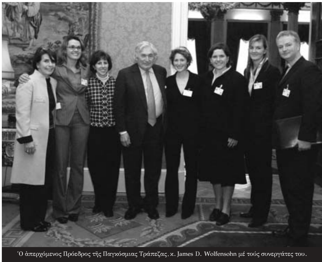
Ὁ ἀπερχόμενος Πρόεδρος τῆς Παγκόσμιας Τράπεζας, κ. James D. Wolfensohn με τούς συνεργάτες του.

Μέ τή συμμετοχή 60 περίπου εκπροσώπων τῶν μεγαλύτερων θρησκειῶν καί διακεκριμένων προσωπικοτήτων ἀπό τό χωρο τῆς ἀναπτυξιακῆς βοήθειας, τῆς βιομηχανίας καί τῶν φιλανθρωπικῶν ἰδρυμάτων, διεξήχθη ἀπό 31ης Ἰανουαρίου μέχρι 1ης Φεβρουαρίου 2005 στήν πρωτεύουσα τῆς Ἴρλανδίας, τό Δουβλίνο, τό Διεθνές Συνέδριο “Πίστη καί Ἀνάπτυξη”. Τή συνάντηση ἐφιλοξένησε στούς ἱστορικούς χώρους τοῦ Dublin Castle ὁ πρόεδρος τοῦ Ὁμίλου τῆς Παγκόσμιας Τράπεζας (World Bank/WB) κ. James D. Wolfensohn μαζί μέ τό Λόρδο τοῦ Clifton, George Carey (πρώην Ἀρχιεπίσκοπο τοῦ Canterbury) καί τόν Ρωμαιοκαθολικό Ἀρχιεπίσκοπο Δουβλίνου Diarmuid Martin. Ἐπειτα ἀπό πρόσκληση τῶν διοργανωτῶν, στό συνέδριο συμμετεῖχε καί ὁ Οἰκουμενικός Πατριάρχης κ.κ. Βαρθολομαῖος, ἡ παρουσία τοῦ ὁποίου χαρακτηρίστηκε ὡς «ἰδιαίτερα σημαντική» σέ ἄρθρο τῆς κυρίας Katharine Marshall, Διευθύντριας καί Συμβούλου τοῦ Προέδρου τῆς World Bank στό θέμα τῆς «Ἀνάπτυξης ἐνός ἐπί ἀξιῶν καί ἠθικῶν ἀρχῶν βασιζομένου διαλόγου», στήν ιστοσελίδα τοῦ Ὁμίλου.