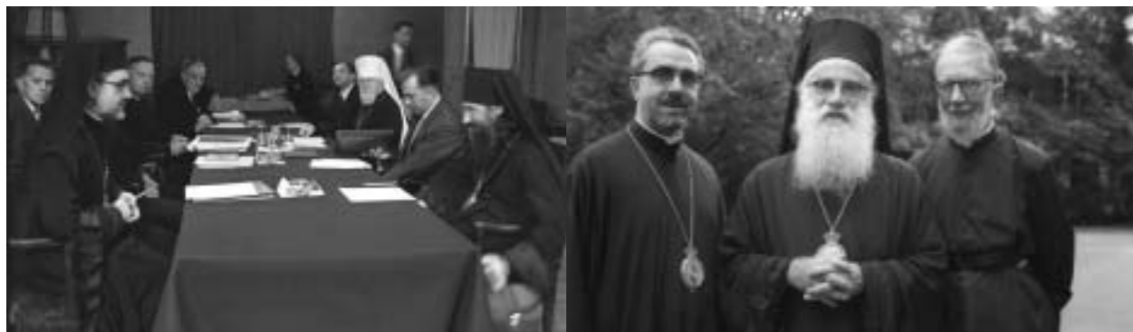
Ἀριστερά: Ἀπό τή συνάντηση ΠΣΕ-Πατριαρχείου Μόσχας τόν Αὐγουστο τοῦ 1958 στήν Οὐτρέχτη: διακρίνονται μεταξύ ἄλλων ὁ Μητρ. Μελίτης Ἰάκωβος, ὁ Franklin C. Fry, ὁ Δρ. W. A. Vissert Hooft, Μητρ. Krutitsky καί Kolomna Νικολαί καί ὁ Ἐπίσκοπος Σμολένσκ Μιχαήλ. Δεξιά: Μητρ. Μελίτης Ἰάκωβος, Ἀρχιεπ. Ἀμερικῆς Μιχαήλ καί π. G. Florovsky (1957).

Ἐκκλησία φαίνεται νά παρακολουθεῖ τίς δραστηριότητες αὐτές μέ μεγάλη προσοχή. Καί ἐκεῖνο πού εἶναι περισσότερο ἐνθαρρυντικό εἶναι ὅτι ἡ Ρωμαιοκαθολική Ἐκκλησία μελετᾷ τήν Οἰκουμενική Κίνηση μέ πολύ ἀντικειμενικό πνεῦμα καί ἐνδιαφέρον.